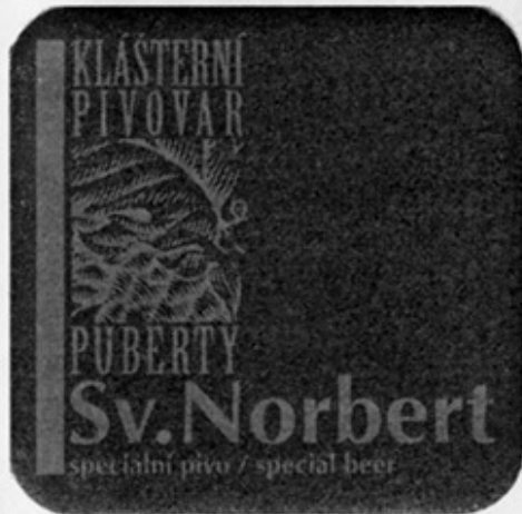
RUS-СПб (Puberty) 1