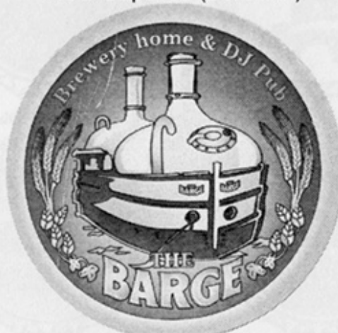
RUS-Томск (The Barge)