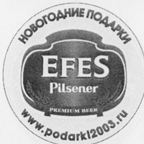
RUS-Москва (Эфес) 1