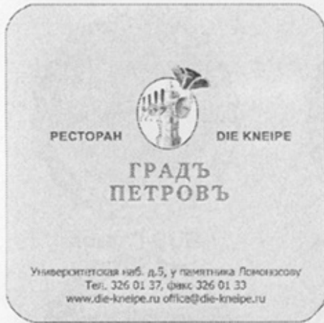
RUS-СПб (Градъ Петровъ)