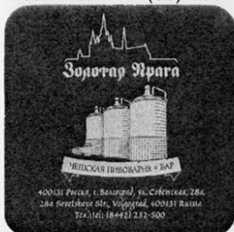
RUS-Волгоград (Золотая Прага)