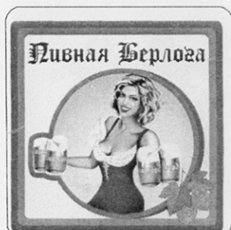
RUS-Ижевск (Пивная берлога) 1