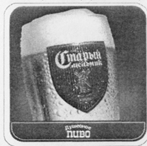
/2 для Казахстана (KZ)