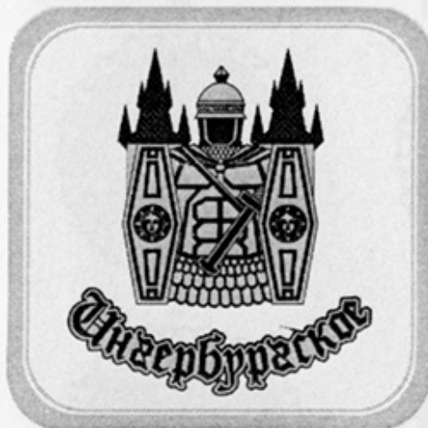
RUS-СПб / Гатчина