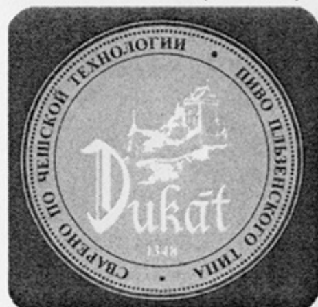
RUS-Самара (Чешский пивовар)